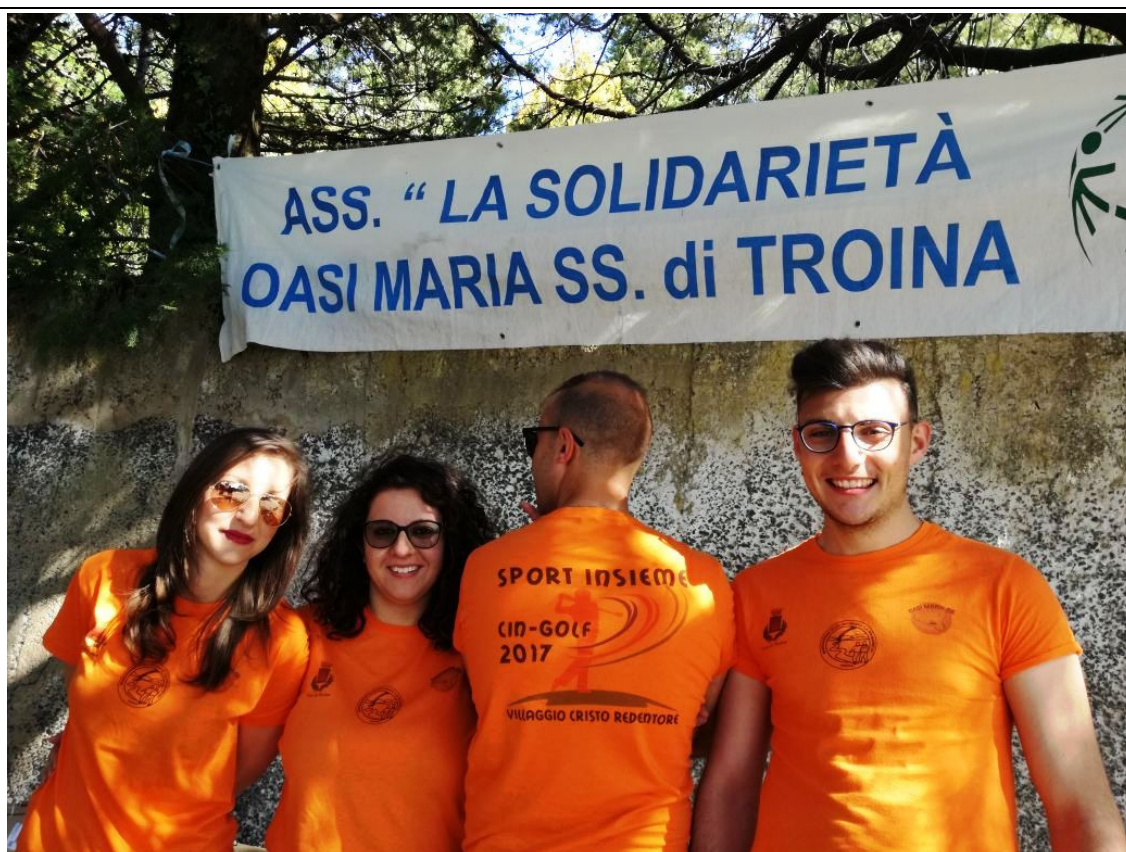
TROINA. CONCLUSA LA NONA EDIZIONE DI "SPORT INSIEME"